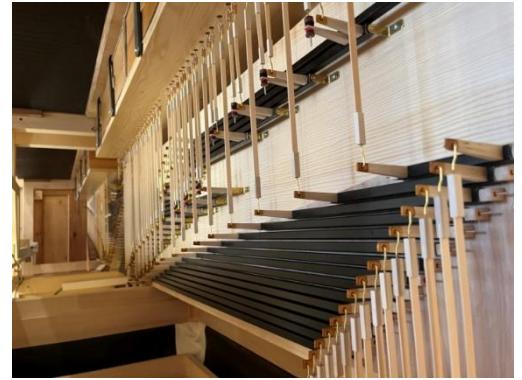
Eindrücke vom Wiedereinbau der Orgel in den Herrnhuter Kirchensaal durch Mitarbeitende der Firma Orgelbau Eule, Bautzen.